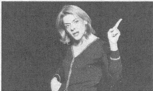
Benoîte Fanton/Cit' en scène

Tenue correcte toujours exigée : univers bobo par Isabeau de R.