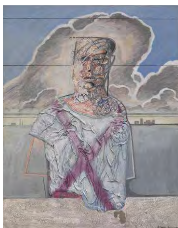
Notre bel avenir