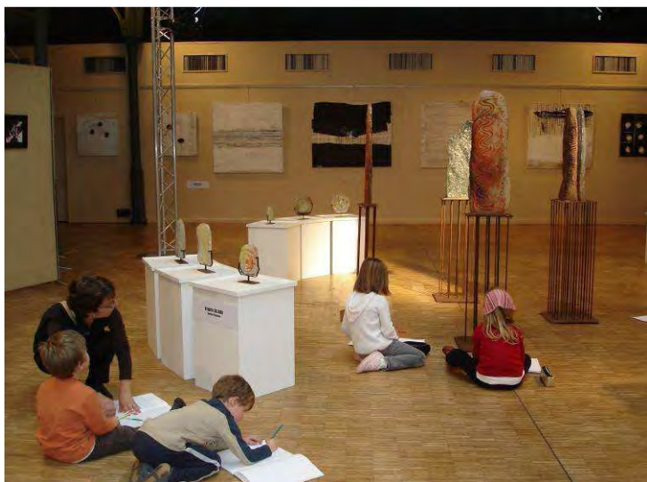
Salon « Transparences » (2010)

Trois salons ont ainsi vu le jour au Sel : « Bleu Majeur » en 2009, suivi par « Transparences » en 2010 et par « Rythme et couleur » cette année.